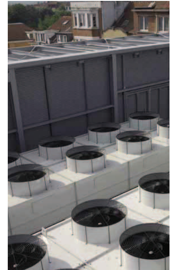
Duco Wall Basic is uitermate geschikt voor 'Screening'

Voor overzicht draagprofielen: zie uitklapbare pagina achteraan deze folder.